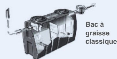
Bac à graisse classique

Ces ouvrages doivent être entretenus régulièrement pour fonctionner correctement.