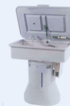
Fontaine de dégraissage biologique

Ces ouvrages doivent être entretenus régulièrement pour fonctionner correctement.